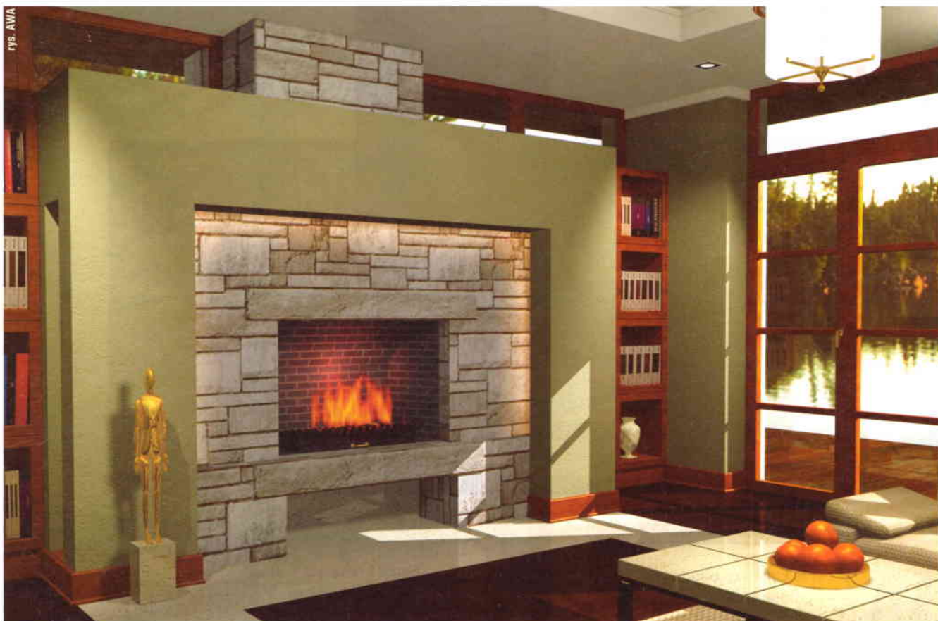
Projekt Bartłomiej Kąkol Maciej Kalisz – AWA

K ominiek jest centralnym elementem biblioteki przylegającej do salonu w dużym domu. Ma prostą formę, w której szczególną uwagę zwrócono na proporcje bryły. Został też starannie wkomponowany we wnętrze pokoju, którego klimat ma sprzyjać relaksowi przy książce i kontemplowaniu widoku za oknem. Obudowa kominka składa się z dwóch warstw stanowiących dwa plany jego bryły. Pierwsza z nich (zewnątrzna) to prosta murowana rama wykończona tynkiem strukturalnym i pomalowana w kolorze ścian pomieszczenia. Podkreśla ją drewniany 16-centymetrowy cokół.